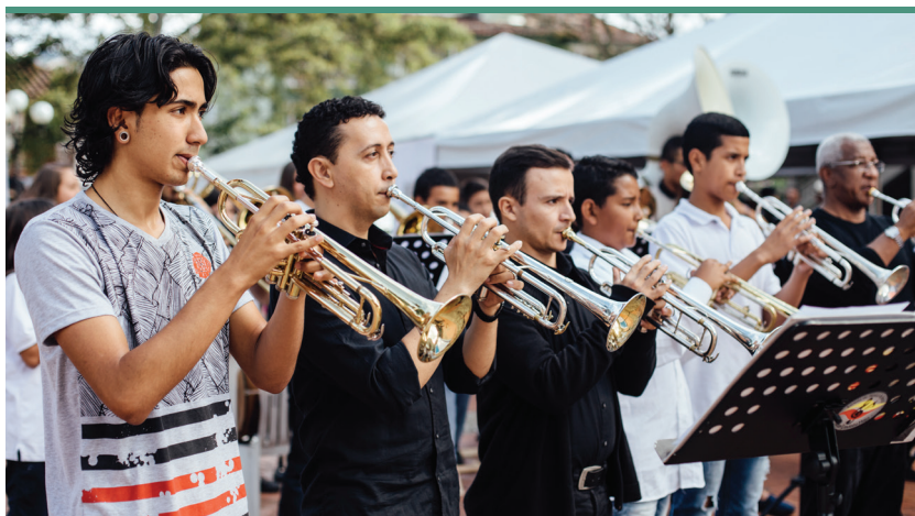
Concierto en Jericó patrocinado por Premex.

educativas públicas de Medellín y sus corregimientos de grados primaria y secundaria, con el fin de transformar el estereotipo negativo existente alrededor del género sinfónico, y así mismo sensibilizar sobre valores ciudadanos intrínsecos a la práctica orquestal, como son la escucha activa, la solidaridad y el trabajo colaborativo, el respeto y la convivencia. En este sentido el proyecto se enmarcó en las propuestas de ciudad que, promoviendo el acceso al arte, buscan sensibilizar al público infantil con el fin de prevenir el acercamiento a contextos violentos o de riesgo.