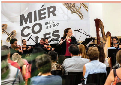
La Orquesta sorprendió a grandes y chicos en centros comerciales de Medellín.

En el Centro Comercial El Tesoro apostamos por realizar charlas enmarcadas en países del mundo: