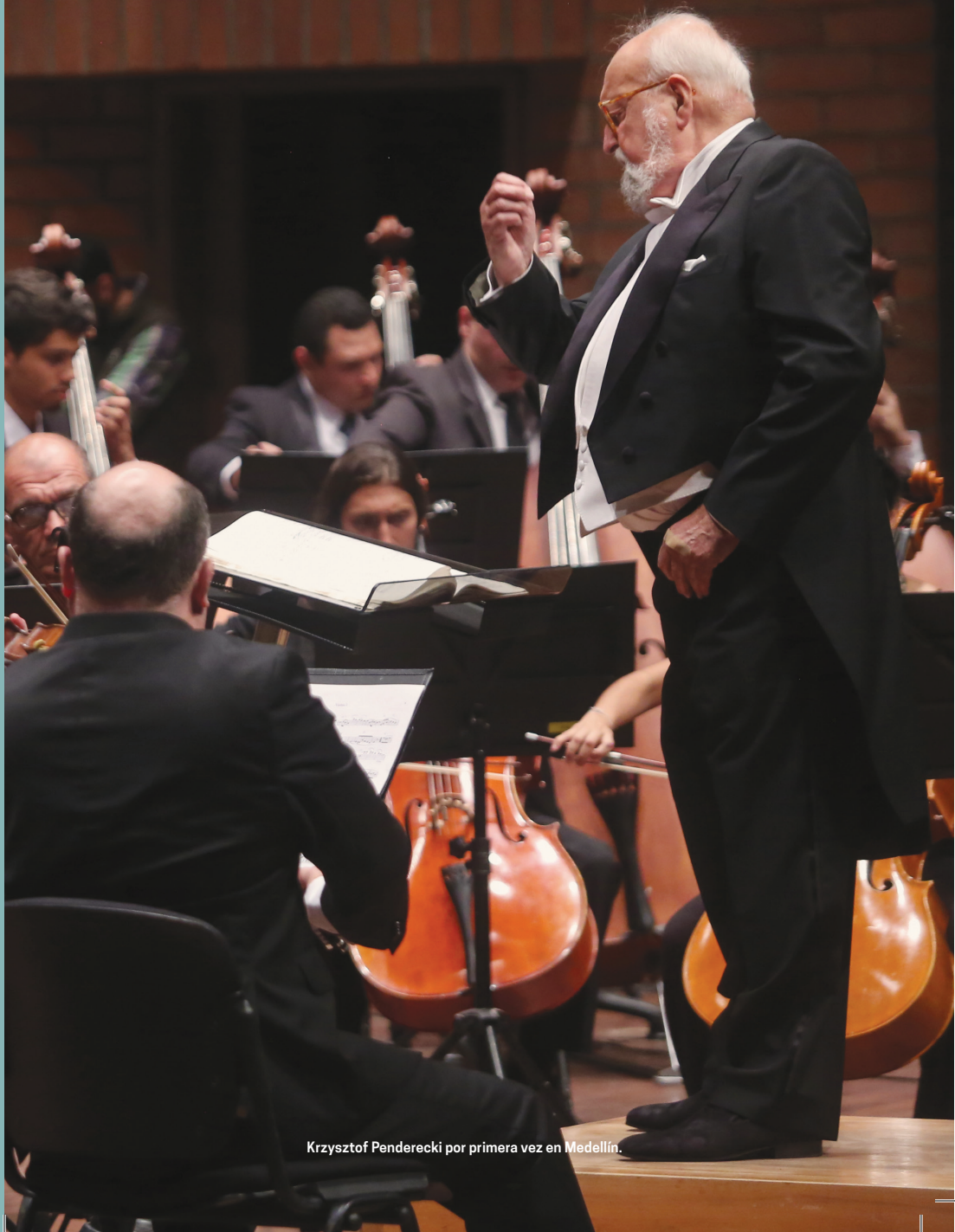
Krzysztof Penderecki por primera vez en Medellín.