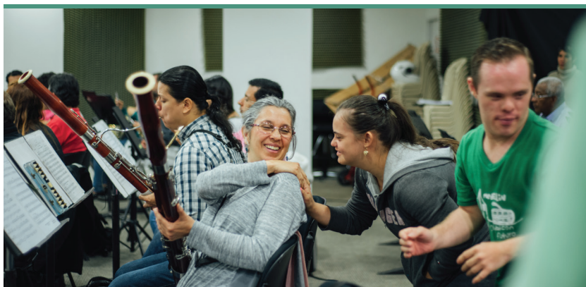
Ensayo para el concierto de cierre del programa Soy Música.

Dieciséis muchachos de las instituciones Comité Rehabilitación, Azul Ilu-