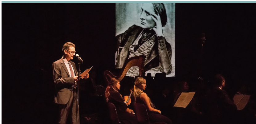
El escritor Pablo Montoya en Postal Sonora: Liszt.