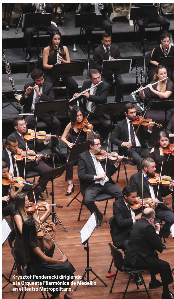
Krzysztof Penderecki dirigiendo a la Orquesta Filarmónica de Medellín en el Teatro Metropolitano.

Así mismo, merece capítulo aparte la unión de las diversas orquestas de la ciudad y actores claves de la escena musical local, para conseguir ofrecer al público montajes de gran embergadura y calidad artística, casi imposibles de realizar sin dichas alianzas y trabajos en común, con el fin de sumar cada vez más a hacer de Medellín una verdadera ciudad de la música.