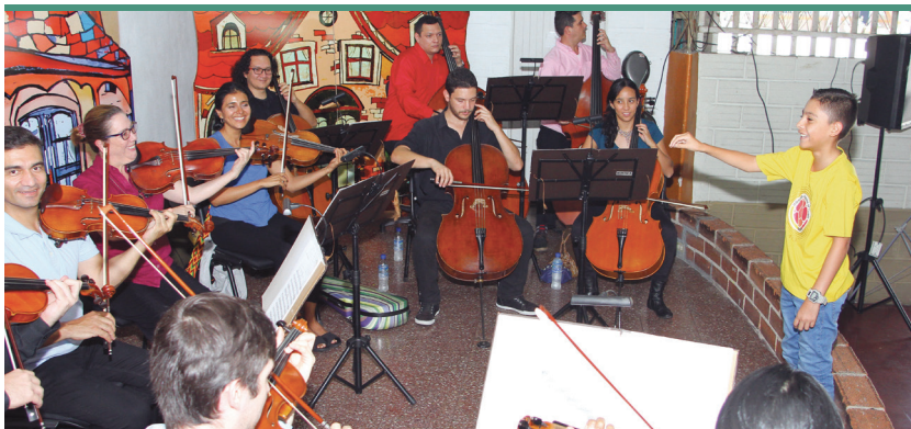
Concierto Pueblo Orquesta en la I.E. La Salle en Campoamor. Patrocina Comfama.

sión, Casa Taller Artesas, Fundación Integrar y Best Buddies (que siguen el proceso de formación) se prepararon para tocar con la Filarmónica en el concierto de cierre dirigido por Camilo Arango Vélez.