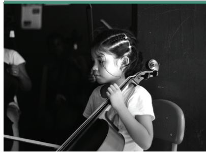
Ensayo proyecto práctica orquestal Fundaunibán.

Este programa –que beneficia a 300 niños– permite la construcción de tejido social, fortalece los derechos cul-